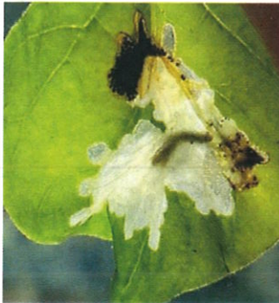
Atac pe frunză – larva și dejecțiile lăsate

În cazul atacului pe fructe, larvele rod galerii și pătrund în interior, favorizând instalarea unor microorganisme saprofite (bacterii, ciuperci), care produc degradarea acestora.