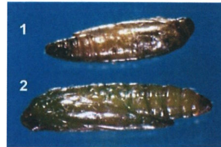
Tuta absoluta – pupe; 1) de mascul; 2) de femelă ( https://www.cabi.org/isc/datasheet/49260 )

Pupele, de 5 – 6 mm lungime, au formă cilindrică și sunt de culoare verde, iar ulterior devin mai închise la culoare.