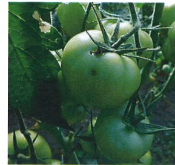
Atac pe fruct la tomate

Minele (galeriile) sunt de formă neregulată, putând fi separate sau unite, în funcție de densitatea populației, iar în interiorul frunzelor se pot observa grămăjoare negre, care reprezintă dejecțiile dăunătorului.