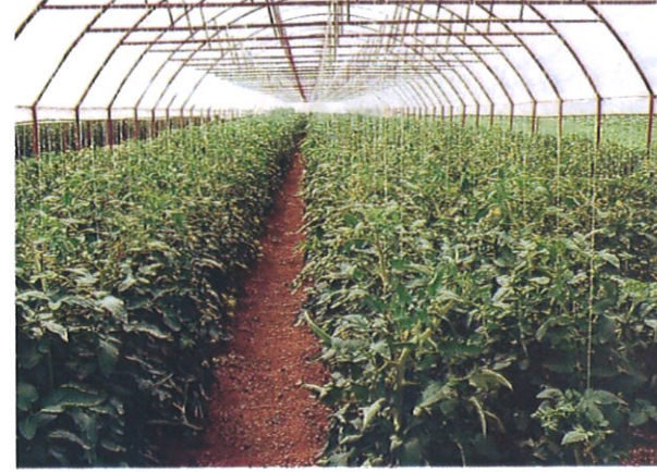
Cultură de tomate în solar, protejată de atacul dăunătorului Tuta absoluta prin complexul de măsuri prezentate

Cifrele scrise cu roșu – grame sau mililitri produs; Cifrele scrise cu negru – kg sau litri produs