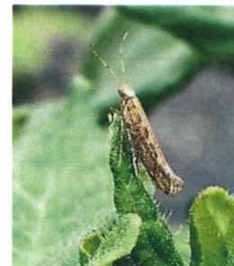
Tuta absoluta - adult

Adulții au 6 – 7 mm lungime, au antene filiforme și solzi argintii spre gri, iar pe fața anterioară a aripilor prezintă pete negre. Femelele sunt mai mari și mai voluminoase, în comparație cu masculii.