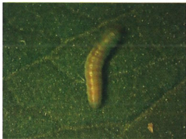
Tuta absoluta - larvă

Larvele de vârstă a IV-a trăiesc în galeriile din frunze, unde se hrănesc și se dezvoltă. Acestea afectează direct foliajul, mugurii terminali, florile și fructele. Larvele mature, de obicei, cad de pe plante și pătrund în sol unde produc coconi subțiri, mătăsoși, care se transformă în prepupe și pupe.