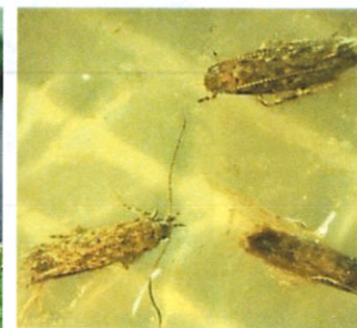
Tuta absoluta – adulți capturați