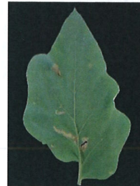
Atac pe frunză la vinete