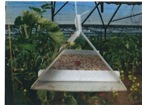
Capcană Delta cu feromoni amplasată în cultura de tomate