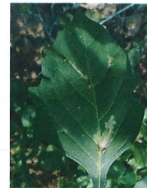
Atac pe frunză la zârna

Controlul dăunătorului Tuta absoluta trebuie început înainte ca larvele să pătrundă în mezofilul frunzelor sau în fructe, unde sunt protejate față de acțiunea produselor de combatere.