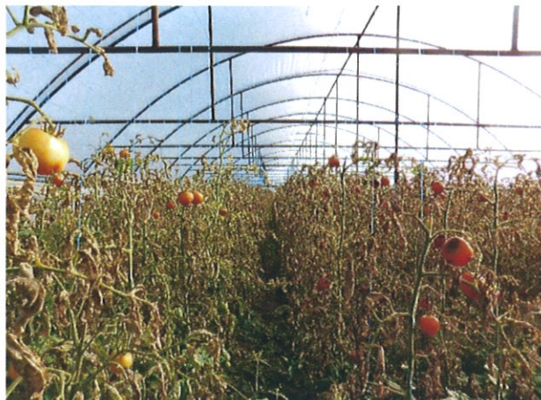
Cultură de tomate atacată puternic de dăunătorul Tuta absoluta (molia minieră)