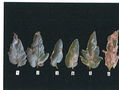
Foliile de tomate cu diferite intensități ale atacului dăunătorului Tuta absoluta

Tuta absoluta , cunoscută sub numele de molia minieră, este un dăunător foarte important al culturilor de tomate. Este întâlnit în Asia, Africa, America Centrală, America de Sud și în Europa, reducând producția cu peste 90%, iar în cazul în care nu se folosesc metode eficiente de prevenire și combatere, se pot înregistra pierderi de 100% (Martins și colab., 2016).